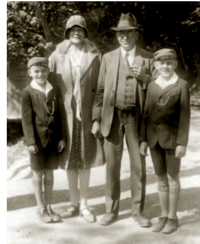
Modebewusste Familie Ende der Zwanziger Jahre

Lassen Sie sich zu einem »Retroevent« animieren (die etwas holprige deutsche Übersetzung: Veranstaltung mit sehnsuchtsvoller Rückwendungsschau). Laden Sie dazu Ihre besten Freunde ein zu einem Essen im Stil der Zwanziger und Beginn der Dreißiger Jahre. Kochen Sie ein exquisites Originalmenü, wie es an Bord der fliegenden Luxusschiffe serviert worden ist. Ihre Gäste tragen dabei selbstverständlich Kleidung, die dem Modekodex der damaligen Zeit entspricht.