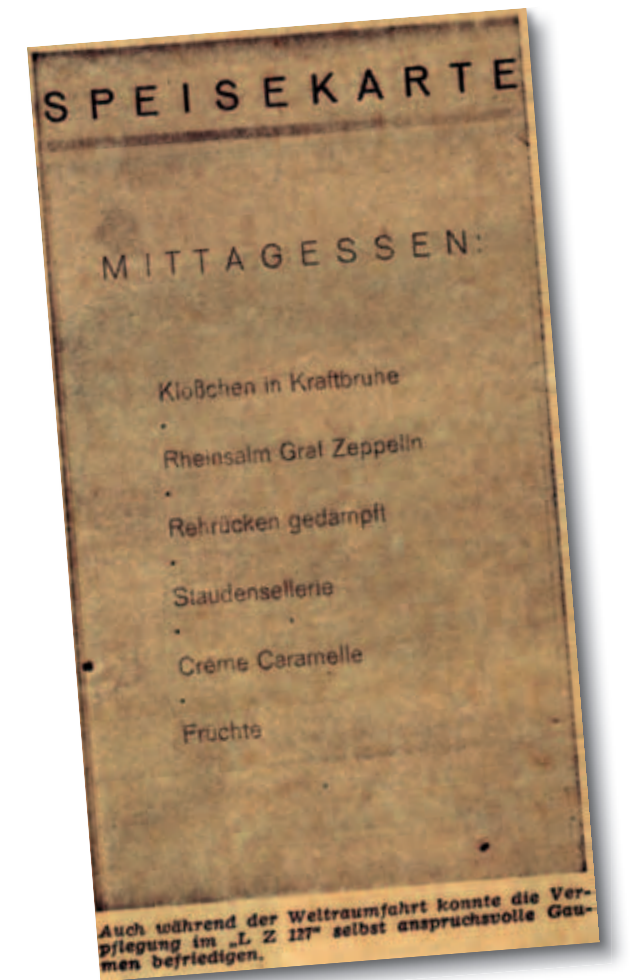
Speisekarte anlässlich der Weltfahrt 1929. Es ist anzunehmen, dass diese Menüfolge auch auf weiteren Fahrten serviert wurde.

möglich, durch das Mitkochen von reichlich Liebstöckel (Maggikraut), Sellerie, Möhren, Petersilie und Zwiebeln, eine fast gleichwertige Qualität zu erzielen wie bei der Verwendung einer Originalbrühe. Selbstverständlich müssen die Kräuter vor dem Servieren herausgefischt werden.