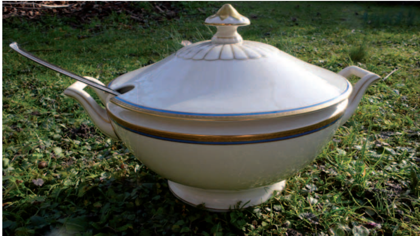
Suppenterrine mit einem Fassungsvermögen von drei Litern

»Weiß ich doch nicht!«, knurrt er unfreundlich. Er zieht aus seiner Rocktasche Bleistift und ein Stück Papier. Überrascht blickt er auf das Ergebnis seines Gekritzels. Als der Steward sich neben der rundlichen Dame herunterbeugt, um zu fragen, ob sie nochmals Suppe wünscht, flüstern sie ihm etwas ins Ohr. Mit einem verhaltenen Grinsen bestätigt er den Überschlag: »Herzlichen Glückwunsch, Frau Miller, Sie haben perfekt gerechnet!«