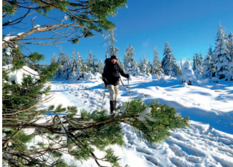
▲ Winterwelt auf 1.000 Metern Höhe: Unterwegs vom Seekopf zur Badener Höhe

Auf dem Hochkopf liegt der Schnee über einen halben Meter hoch,