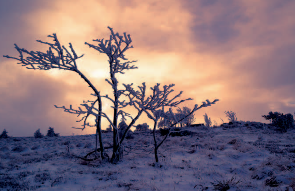
▲ Die Hochfläche der Hornisgrinde erscheint uns wie ein geheimnisvoller Planet aus Eis und Schnee

wird, verrät uns das Schild nicht. Wir können uns darauf keinen Reim machen und gehen weiter. Plötzlich taucht direkt vor uns ein dunkler Schatten auf. Er ist riesig. Landet vor uns etwa ein Raumschiff? Wir sind völlig perplex, weil wir keine Ahnung haben, was das ist. Dann – für einen kurzen Augenblick – lichtet sich der Nebel, und vor uns taucht der gewaltige Funkturm der Hornisgrinde auf. So plötzlich er erscheint, so schnell ist er im Nebel verschwunden, als wäre er nie da gewesen.