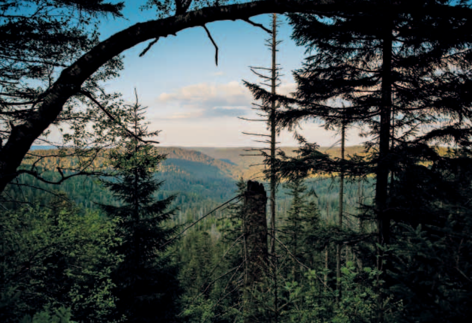
▲ Blick über das Bannwaldgebiet „Wilder See“

und Besuchseinrichtungen werden in dieser Zone gepflegt, in der Pflanzen und Tiere den Vorrang haben. Besucher dürfen die Wege nicht verlassen, um den Schutz der Tier- und Pflanzenwelt zu gewährleisten.