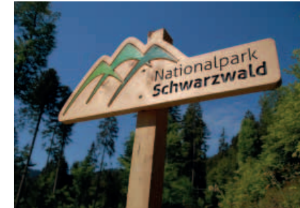
▲ Die Nationalpark-Schilder mit Logo sind an allen Zugangswegen zum Nationalpark angebracht

Der Mensch soll die natürlichen Prozesse im Nationalpark beobachten und erleben. Dazu werden vom Nationalpark-Team verschiedene Zonen eingerichtet. In der „Kernzone“ greift der Mensch nicht ein, hier ist die Natur zu 100 Prozent sich selbst überlassen. Lediglich Wege