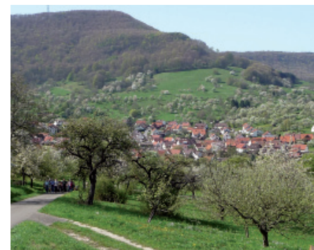
Blühende Obstbäume bei Glems

In Kappishäusern fahren wir Richtung Metzingen bis zur Landesstraße. (Hier kann, wer mit Tour 16 kombinieren möchte, nach rechts weiter Richtung Kohlberg fahren.) Wir überqueren die Straße Richtung Sportheim. Der Weg führt an der Gaststätte Sportheim