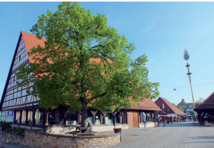
Kelternplatz in Metzingen

kurz nach Überqueren der Gleise folgen wir den Wegweisern zum Bahnhof nach links und sehen ihn auch schon nach kurzer Fahrt vor uns liegen. Von hier aus kann, wer mag, mit dem Zug zurück nach Reutlingen fahren. Wir fahren nach rechts zum Kelternplatz.